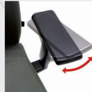
Reposabrazos orientables Arm pivot Accoudoirs pivotants