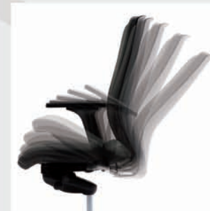
Mecanismo sincronizado Synchronized mechanism Système synchrone