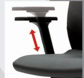
Regulación en altura de los reposabrazos Arm height adjustment Accoudoirs réglables en hauteur