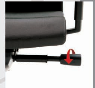
Bloqueo en 3 posiciones del mecanismo sincronizado y sistema anti-retorno