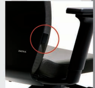
Regulación en altura del soporte lumbar Lumbar height adjustment Soutien lombaire