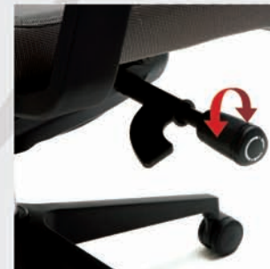
Regulación de la tensión del movimiento sincronizado para distintos pesos corporales